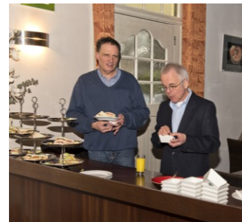
Twee Vanini-kenners aan de lunch