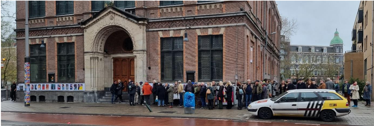
In de rij voor Paradiso

Op 26 november hield de Amsterdamse Spinozakring haar jaarlijkse Spinozadag in Paradiso. De dag werd zoals gebruikelijk massaal bezocht. Er waren ca 600 mensen. De sfeer zat er goed in mede dankzij optredens van zangeres Fay Lovsky en Freek de Jonge.