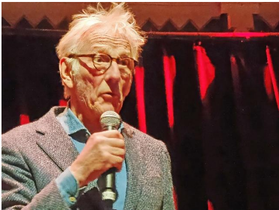
Freek de Jonge