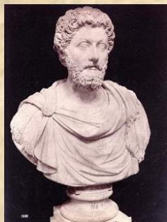
(mogelijk) Marcus Fronto

Junius Rusticus onderwees hem in de leer van de Stoa.