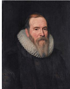
Johan van Oldenbarnevelt