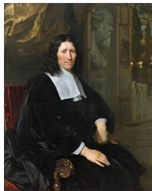
Pieter De la Court

In boeken als Interest van Holland , Politike Weeg-schaal en Sinryke Fabulen fulmineerden ze tegen het stadhouderschap nadat Willem II in 1650 een poging tot staatsgreep had gedaan. Toen hij nog hetzelfde jaar overleed ontstond het eerste stadhouderloze tijdperk, dat door de De la Courts werd aangegrepen om te pleiten voor de definitieve afschaffing van het stadhouderschap en van de regentenoligarchie. De soevereiniteit lag wat hen betreft bij het volk.