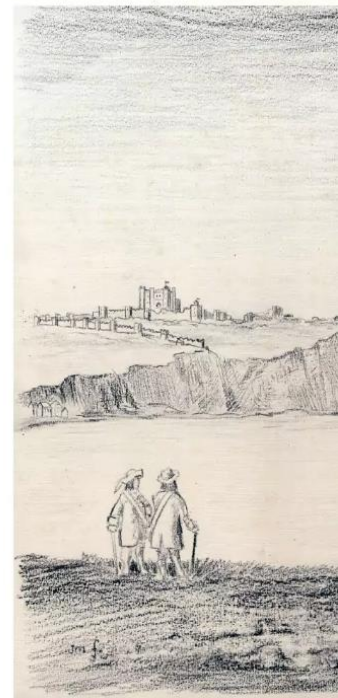
DEN GROOTEN TOER VAN DE GEBROEDERS DE WITT ZONDAG, NPO 2, 20.20

Geschiedenisserie over het de reis die de gebroeders De Witt maakten van oktober 1645 tot juli 1647.