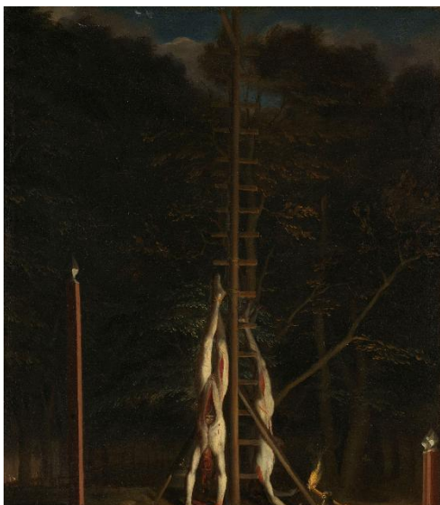
Figuur 4: Ontzielde lichamen van Johan en Cornelis de Witt

Het iconische beeld dat we kennen van Johan en Cornelis is het schilderij waarop hun ontzielde lichamen omgekeerd zijn opgehangen na de moord op de gebroeders op 20 augustus 1672. Voor de geschiedschrijving was het een voordeel dat alle documenten van Johan direct een dag later in beslag zijn genomen en overgedragen aan het Hof van Holland, later het archief, zodat alles nu nog beschikbaar is. Dat was niet zo bij een voorganger van Johan de Witt, Jacob Cats (1577-1660).