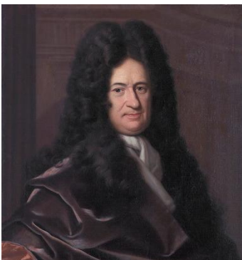
Figuur 13: Gottfried Wilhelm von Leibniz

De anekdote is dat Spinoza, toen hij van de moordpartij vernam, een pamflet wilde plakken bij de Gevangenpoort met de tekst: Ultimi Barbarorum : het zijn de ergste barbaren. Zijn huisbaas heeft hem toen tegengehouden tot Spinoza weer tot bedaren was gekomen. Het pamflet is dus nooit opgehangen en dat was maar beter ook voor Spinoza: hij had het er niet levend van afgebracht. Deze anekdote staat in iedere biografie van Spinoza en van Johan de Witt. Als motivatie voor de actie van Spinoza werd zijn vriendschap met Johan de Witt genoemd. Maar die was er niet! Dus klopt deze anekdote wel? Waar komt de anekdote vandaan?