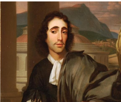
Figuur 10: Benedictus de Spinoza

A: Johan de Witt laat zich er in zijn brieven niet over uit. Hij was geen filosoof. Maar hij zal in die tijd van de dertigjarige oorlog tussen Engeland en Frankrijk waarbij hij op bezoek is geweest bij Lodewijk XIV en Charles I zeker hebben gedacht van 'dit willen we in de Republiek niet'. Maar hij heeft er niets over geschreven; het heeft hem zeker wel beïnvloed. Verder heeft het ook zijn afkeer van monarchieën gevoed, waarbij macht wordt geërfd.