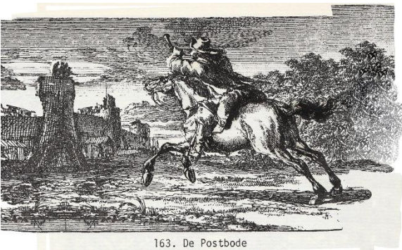
Figuur 7: Postbode snelt naar Amsterdam

zes regenten gevangen, waaronder Jacob de Witt, de vader van Johan, en zetten hen gevangen in slot Loevestein. Het was niet zomaar een gevangenis: de gevangen regenten hadden hun eigen kamer en ook personeel, maar het liep niet altijd goed met hen af (Hugo de Groot).