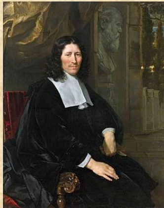
Pieter de la Court.

Dit hoofdstuk beschrijft hoe de beide broers tot hun politiek missie kwamen en het daaruit voortvloeiende politieke debat.