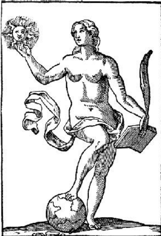
"Verita" in Cesare Ripa, Iconologia overo descrittione di diverse imagini cavate dall'antichità, & di propria inventione [1603]

Maar hoe kenden Graat en Spinoza elkaar? Waarschijnlijk hadden ze wel gemeenschappelijke kennissen. Spinoza had in Amsterdam gewoond en woonde weliswaar in 1666 in Voorburg maar hij kwam wel af en toe in Amsterdam. En de wijze van schilderen (nat in nat) vereiste maar 1 poseersessie.