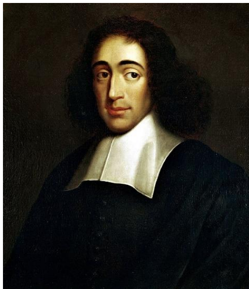
Anoniem, Postuum portret van Spinoza, olieverf op doek, ca. 1700, Herzog August Bibliothek, Wolfenbüttel.

Beide portretten zijn na de dood van Spinoza gemaakt maar met name het portret uit de Opera Postuma moet goed gelijken omdat het door vrienden van Spinoza die het werk samenstelden, is gebruikt.