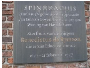
Plaquette naast de voordeur