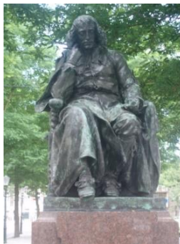
Standbeeld Spinoza voor zijn huis