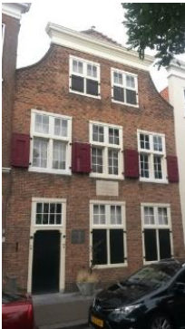
Spinoza's woning aan de Paviljoensgracht